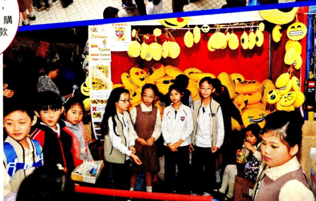
▲每班負責一個遊戲攤位，學生可從中學習團體合作。