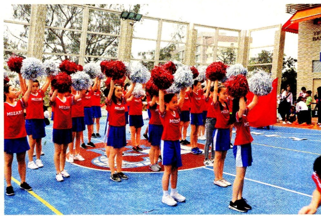
▲啦啦隊在籃球比賽開始前表演，落力為健兒打氣。