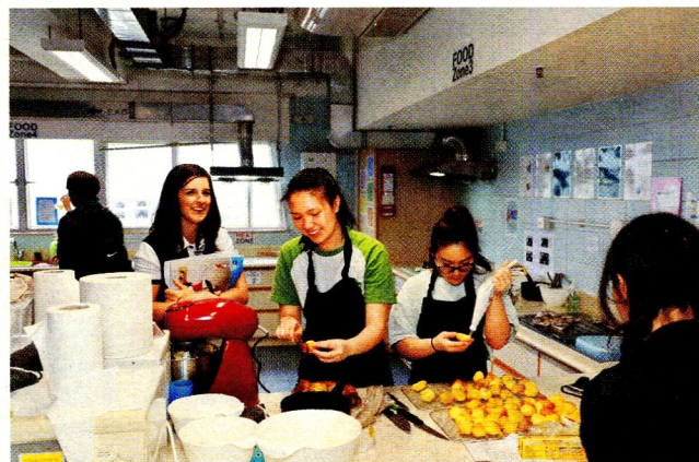
▲初中學生可以接觸不同科目，包括食物科技，開放日也有食物科技活動，讓學生比併廚藝。